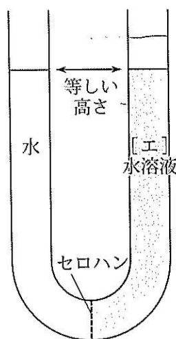
図1 中央部をセロハンで仕切られたU字管の左右に入れられた水と [ エ ] 水溶液の初めの状態

図1のように，U字管の中央部をセロハンで仕切り，左側には水を入れ，右側には [ エ ] 水溶液を入れて，左右等しい高さとする，分子量の小さい水分子はセロハンを通して行き来できるが，分子量の大きい [ エ ] 分子はセロハンを通過できない。このように，溶液中のある成分のみが通過できる膜を [ ケ ] とよぶ。そして，この状態からしばらく放置すると，